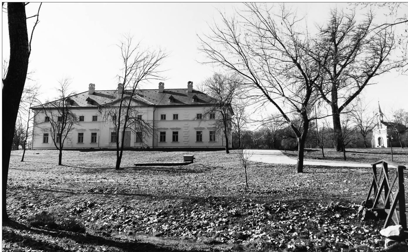
A felújított angolparkos kastélyban irodalmi és tangóesteket tartanak majd, és szálláshelyeket is kialakítottak az utazók számára

Bölcske a fővárostól alig egy órány autóra fekszik Tolna megyében, Dunaföldvártól délre. Egykor kelte település állhatott itt, a Nemzeti Múzeumban látható az a római kori sírkő, amelyre 1844-ben a régi templom lebontásakor